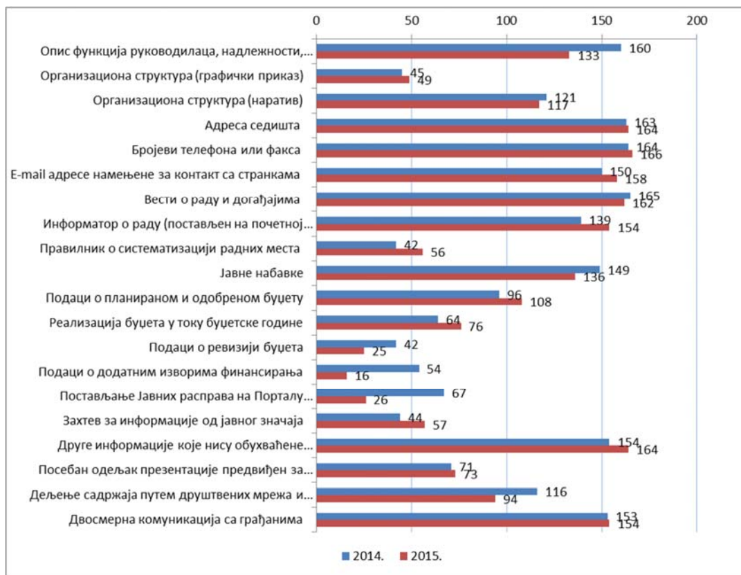
Дијаграм 1- Број ЈЛС који испуњава критеријум Садржај (подаци оцењивања за 2014. и 2015. годину)