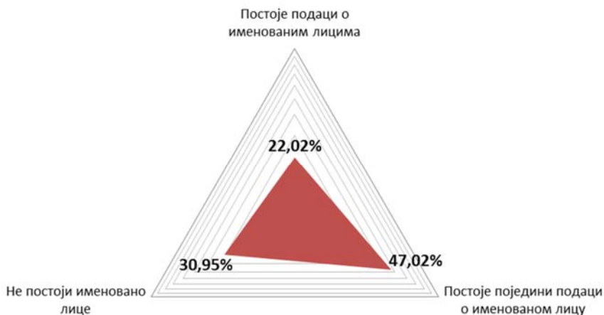
Дијаграм 3 - Резултати оцењивања (2015. год.) – Критеријум: Одржавање веб презентације