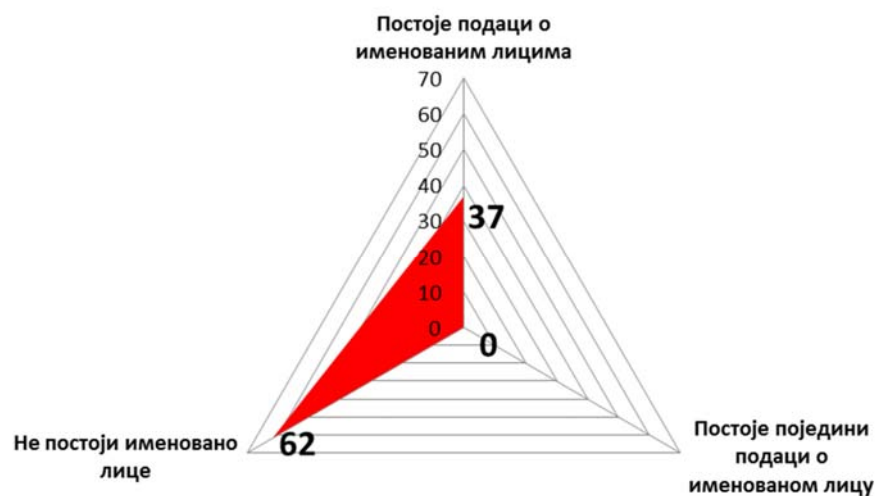
Дијаграм 2- Резултати оцењивања (2015. год.) – Критеријум: Одржавање веб презентације